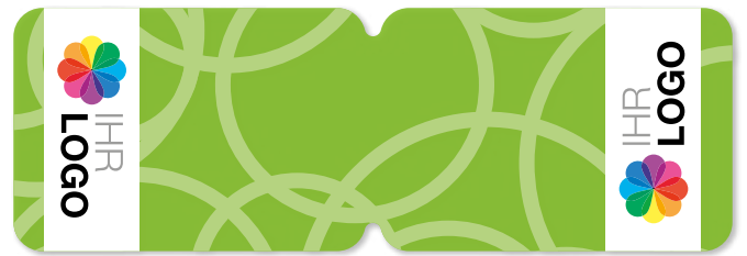
Ansicht des fertigen PocketCleaner®